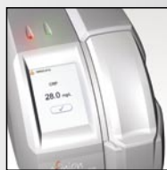
Registrare il risultato