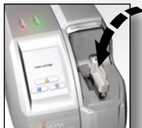
Inserire la cartuccia

Basta inserire la cartuccia nell'analizzatore e il risultato appare in pochi minuti senza alcuna ulteriore operazione!