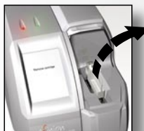
Rimuovere la cartuccia